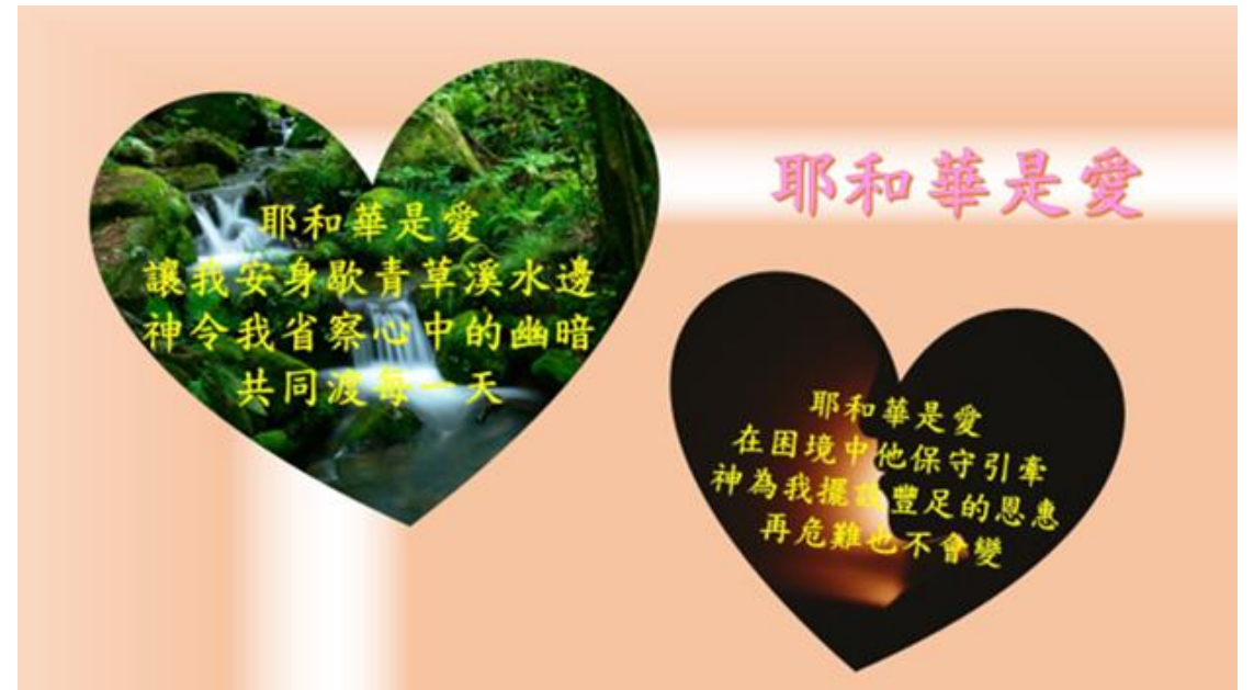
耶和華是愛 (粵語版)